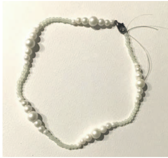
Skadi Badenber, 5a

TIPP: Ihr könnt euch auch am Anfang die Reihenfolge erst einmal hinlegen, dann könnt ihr es euch besser merken und es noch mal angucken, falls ihr die Reihenfolge vergessen habt.